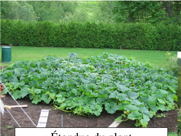
Étendue du plant le 6 juillet 2006