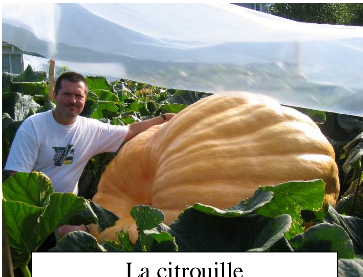
La citrouille le 23 août 2006