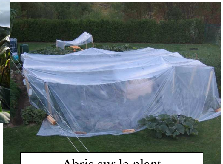
Abris sur le plant le 10 septembre 2006